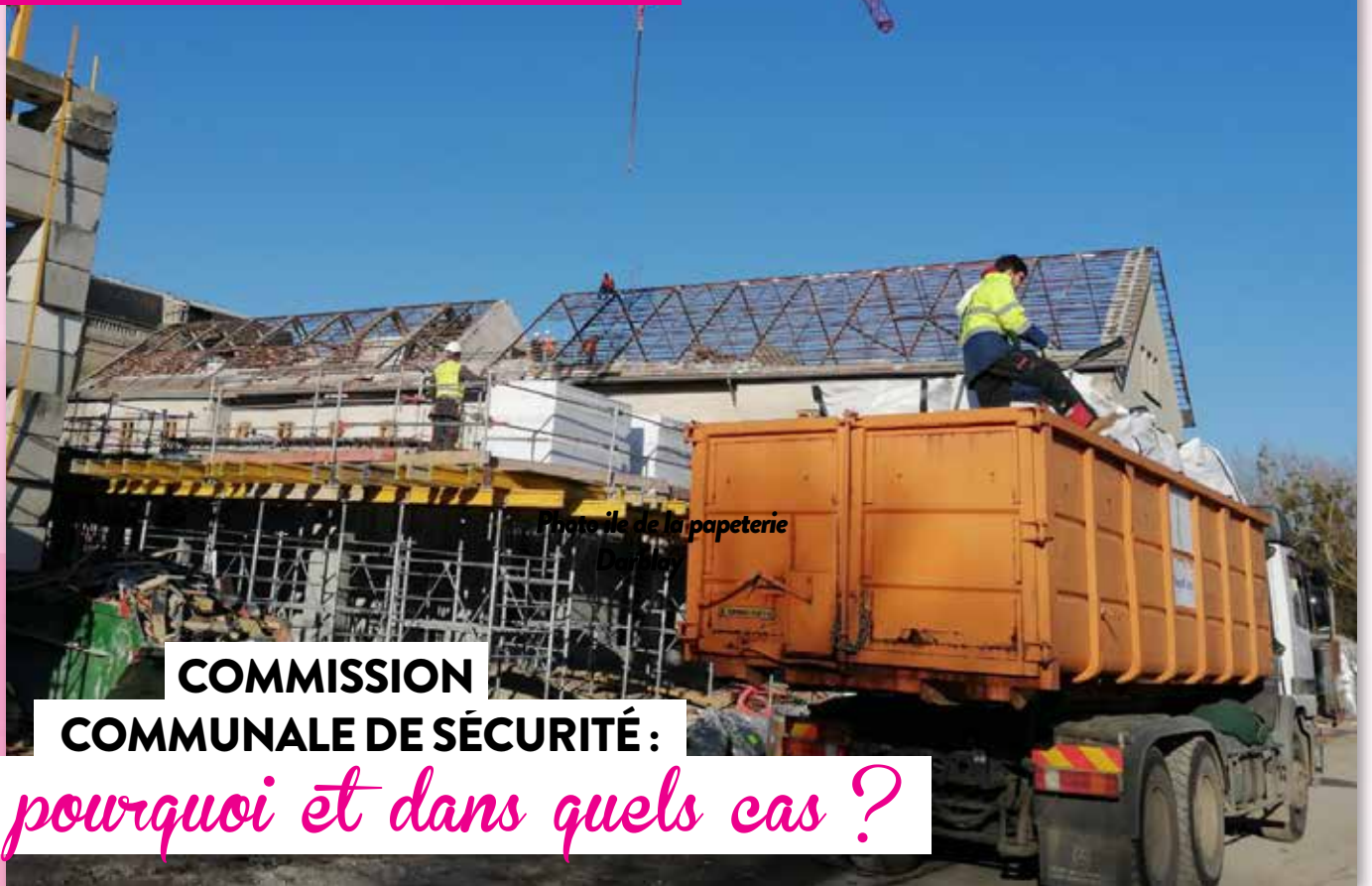
Photo île de la papeterie