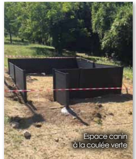
Espace canin à la coulée verte

Les 3 boîtes à livres, inaugurées pendant la villabéenne poétique et réalisées en régie, peintes par les enfants du centre de loisirs ont été installées aux abords des squares de la commune. Nous remercions une nouvelle fois l'association des familles de Villabé pour cette belle initiative en faveur du partage, de la culture et du savoir pour tous.