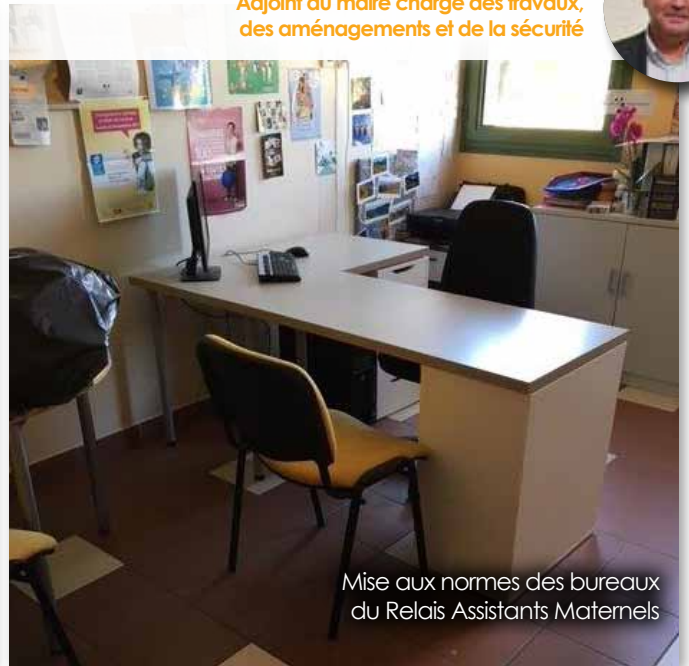
Mise aux normes des bureaux du Relais Assistants Maternels