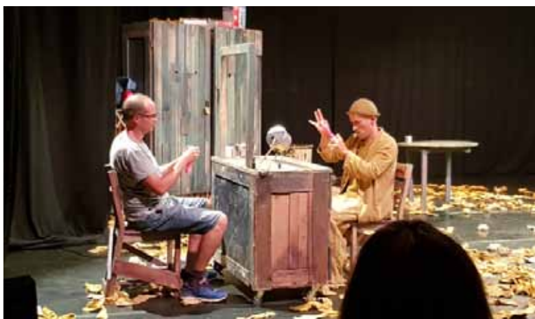
Spectacle : Rien à Dire