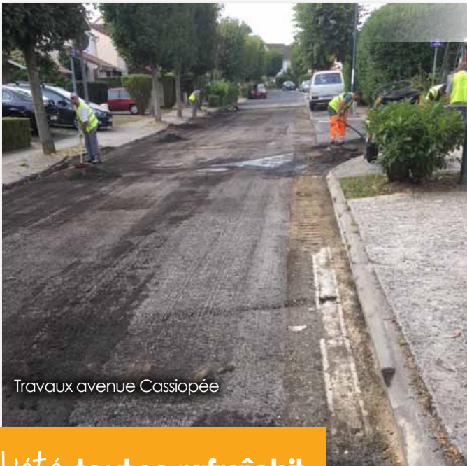
Travaux avenue Cassiopée