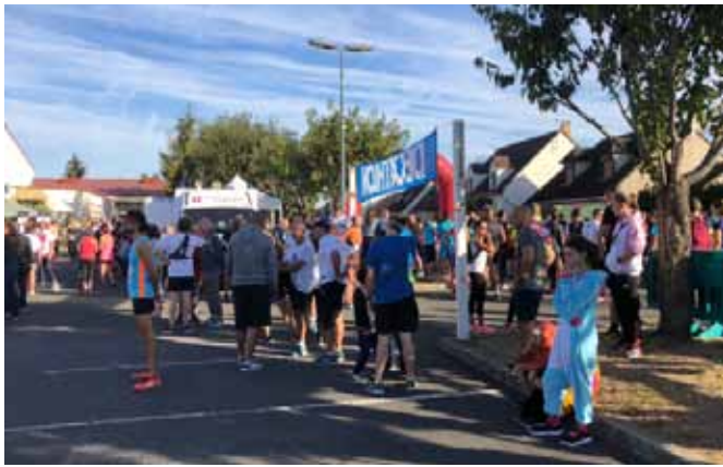
4 ème édition de la Foulée des Brettes