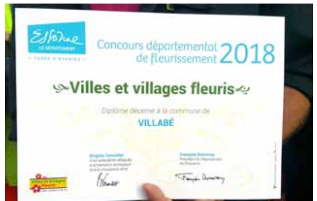
Villabé nommée ville fleurie 2018