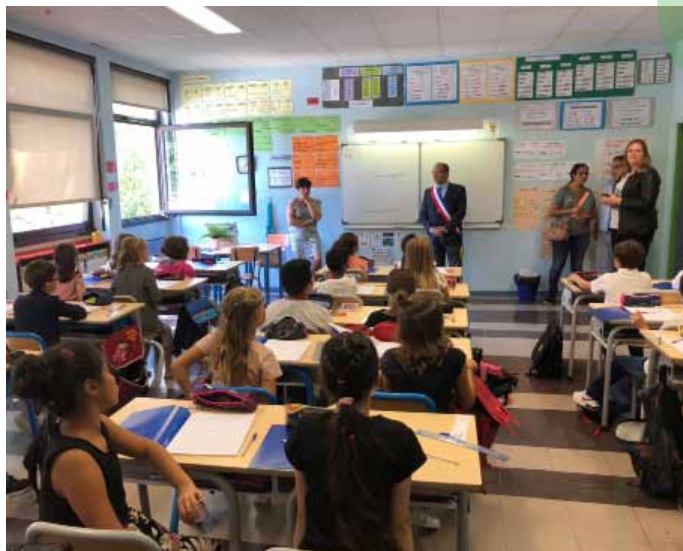
Rentrée des classes