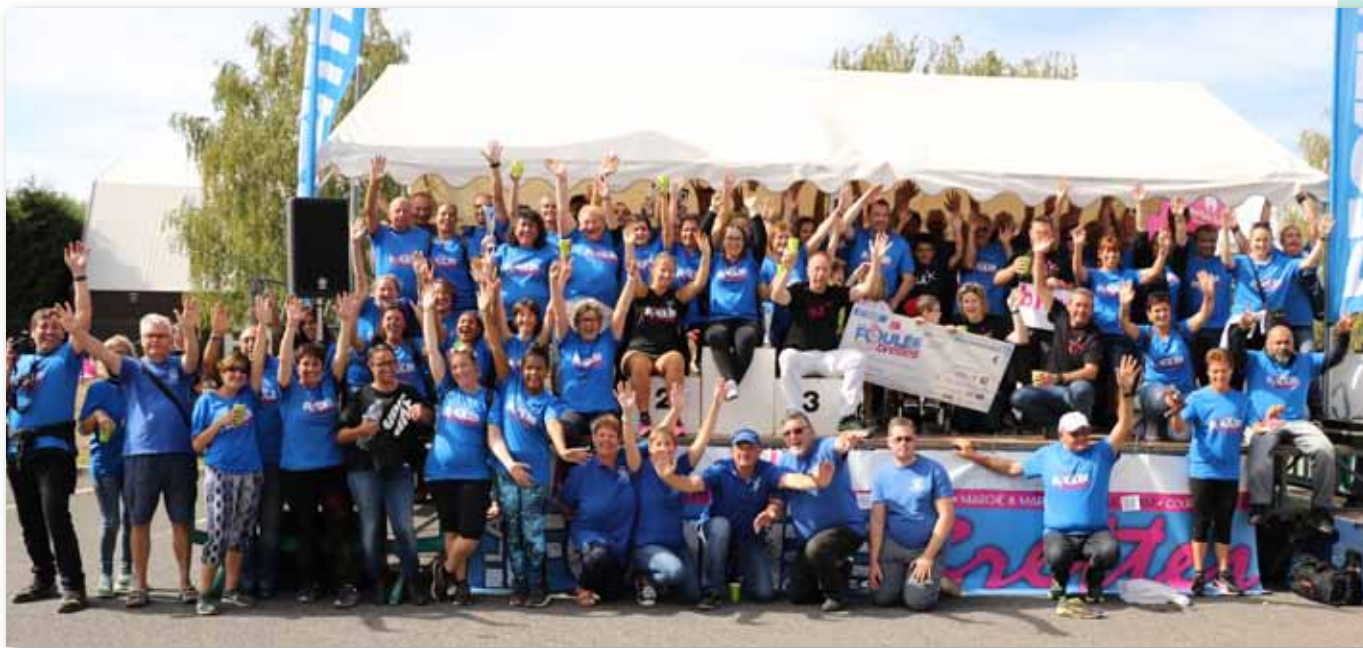
Cette course n'aurait pas lieu sans nos charmants bénévoles... merci à eux !