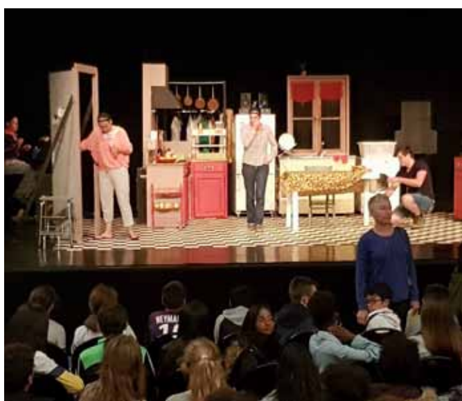
Spectacle : Les femmes savantes