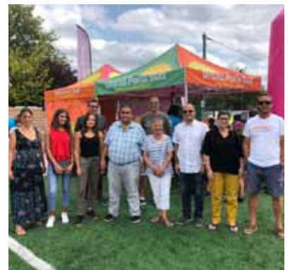
Agglo Fun Tour