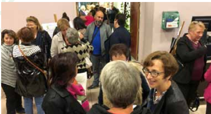
Repas des Associations