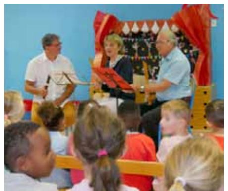
Rentrée des classes dans nos deux groupes scolaires et en musique dans les écoles maternelles