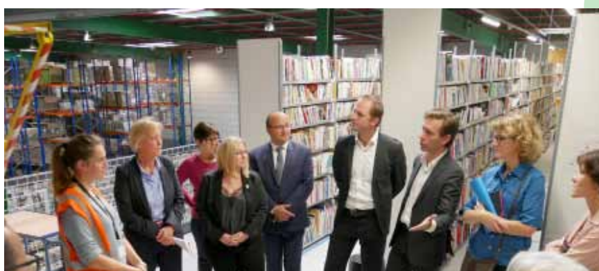
Visite de Madame Sophie CLUSEL, Secrétaire d'État chargée du handicap.