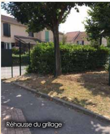
Réhausse du grillage

Dans la continuité des travaux de rénovation énergétique, la 2 ème tranche des travaux a eu lieu cet été avec le changement de fenêtres du 1 er et 2 ème étage du bâtiment de la restauration scolaire Jean-Jaurès. Comme au rez-de-chaussée, des fenêtres en aluminium ont été installées.