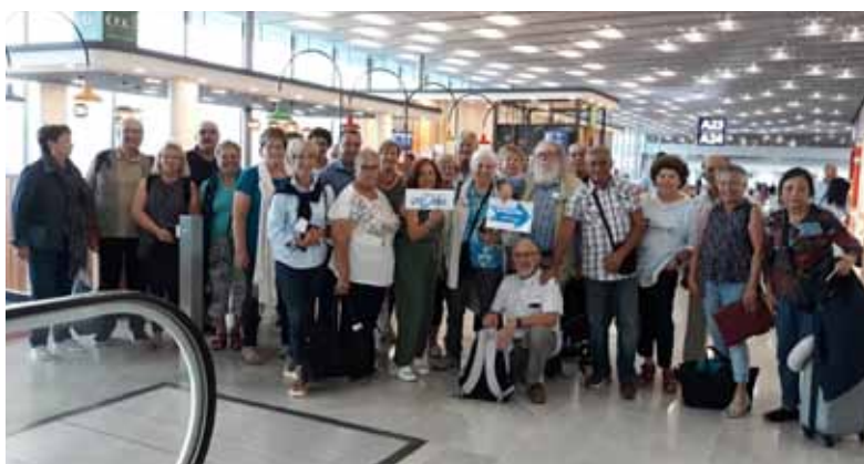
Voyage en Croatie pour nos seniors