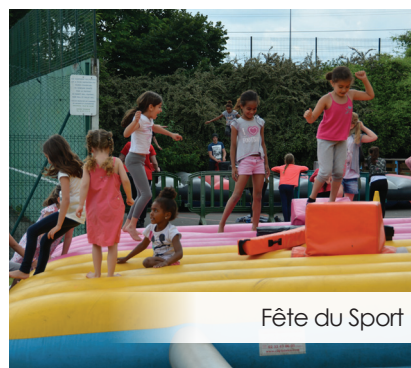
Fête du Sport