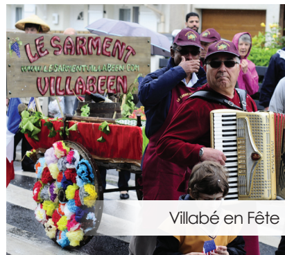
Villabé en Fête