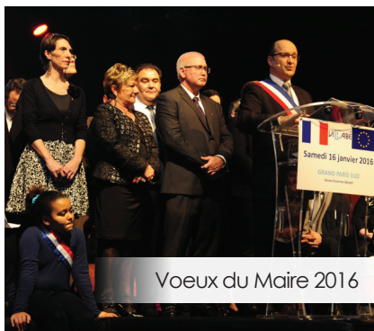
Voeux du Maire 2016