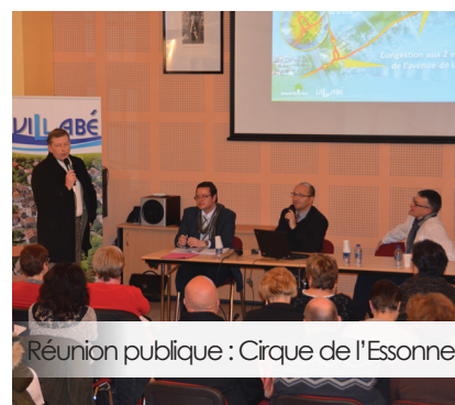
Réunion publique : Cirque de l'Essonne