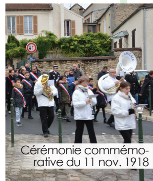
Cérémonie commémorative du 11 nov. 1918