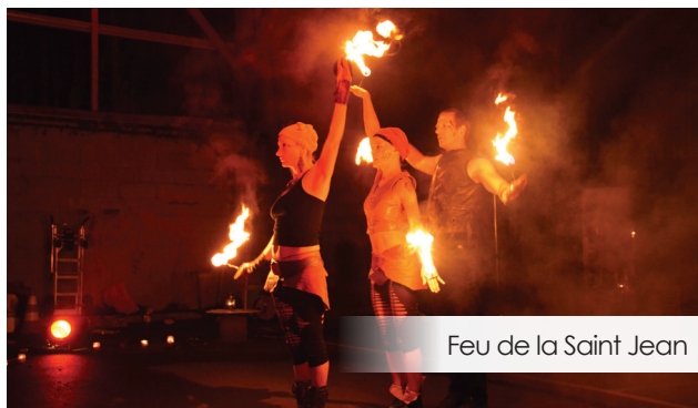
Feu de la Saint Jean