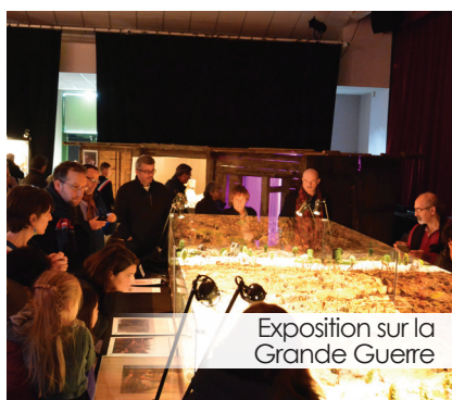
Exposition sur la Grande Guerre