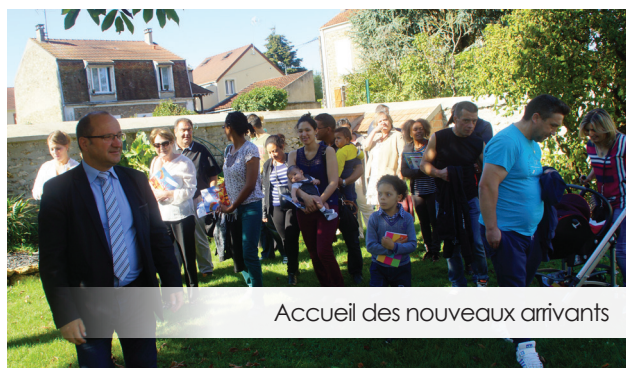
Accueil des nouveaux arrivants