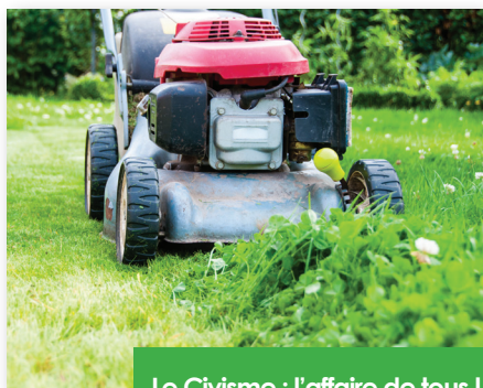
Le Civisme : l'affaire de tous !