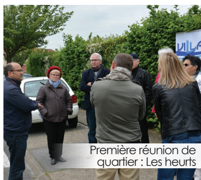
Première réunion de quartier : Les heurts