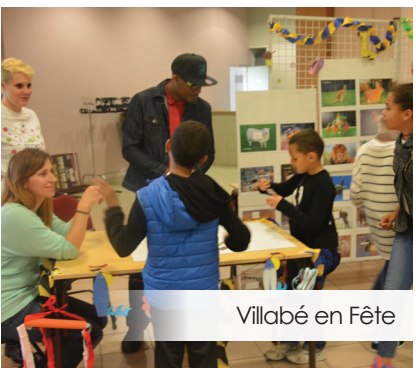
Villabé en Fête