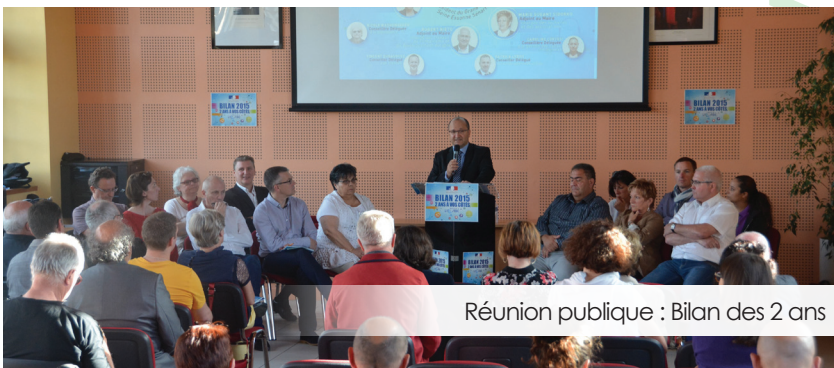
Réunion publique : Bilan des 2 ans