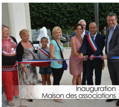
Inauguration Maison des associations