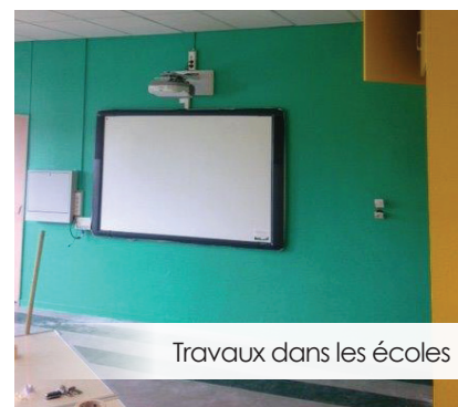
Travaux dans les écoles