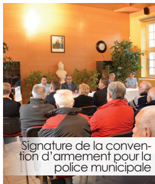
Signature de la convention d'armement pour la police municipale