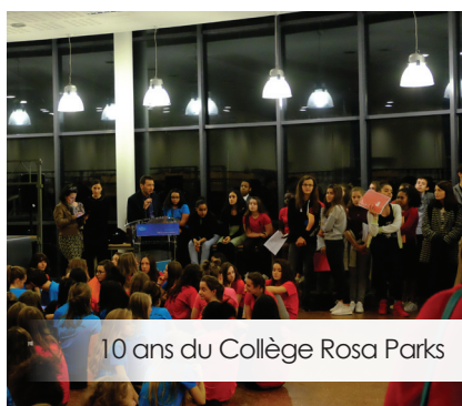
10 ans du Collège Rosa Parks