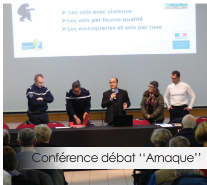
Conférence débat "Arnaque"