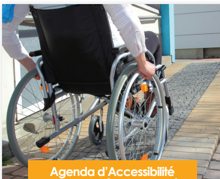
Agenda d'Accessibilité programmé pour Villabé