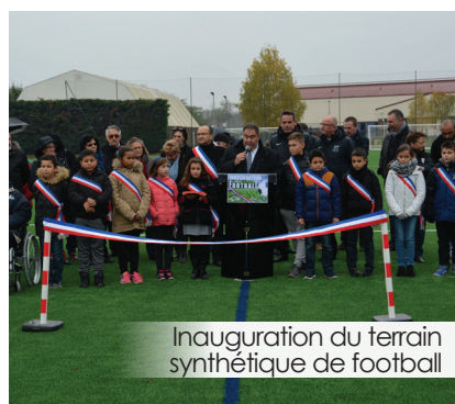
Inauguration du terrain synthétique de football