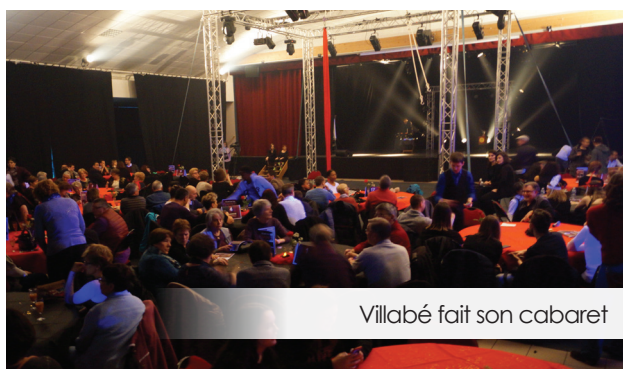
Villabé fait son cabaret