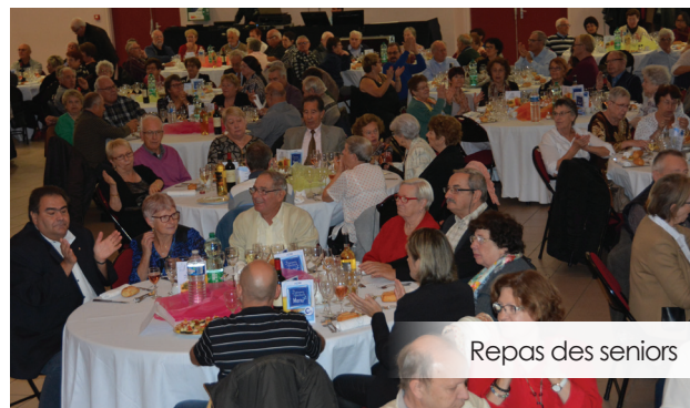
Repas des seniors