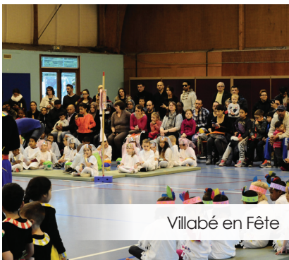
Villabé en Fête