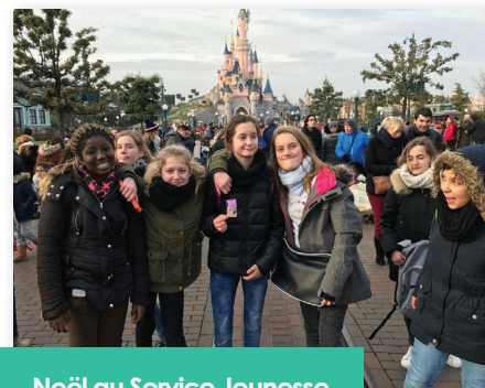
Noël au Service Jeunesse