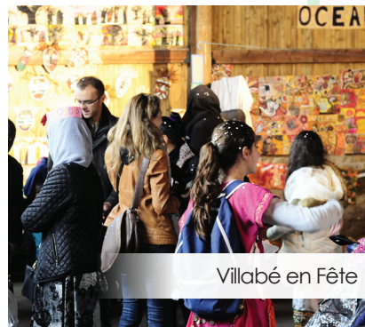
Villabé en Fête