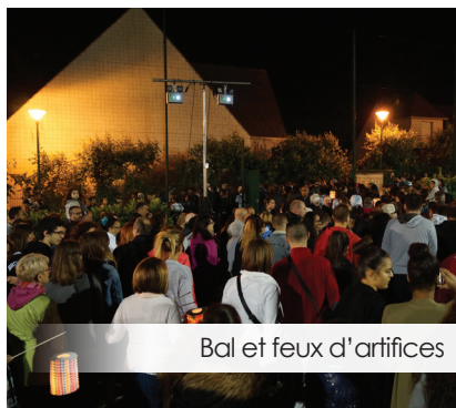
Bal et feux d'artifices