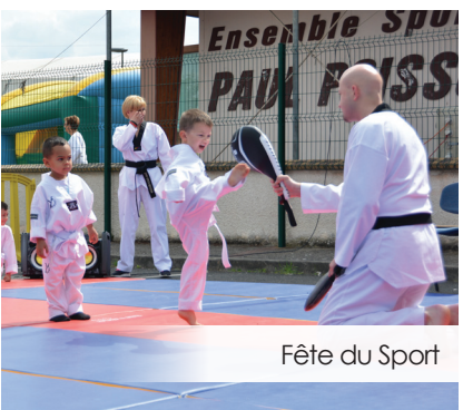
Fête du Sport