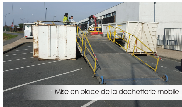
Mise en place de la déchetterie mobile