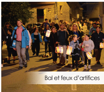
Bal et feux d'artifices