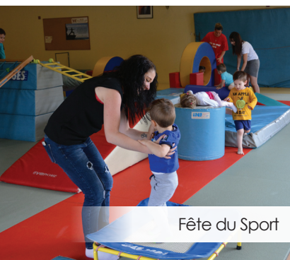
Fête du Sport