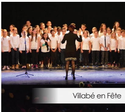
Villabé en Fête