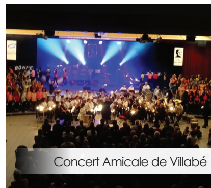
Concert Amicale de Villabé