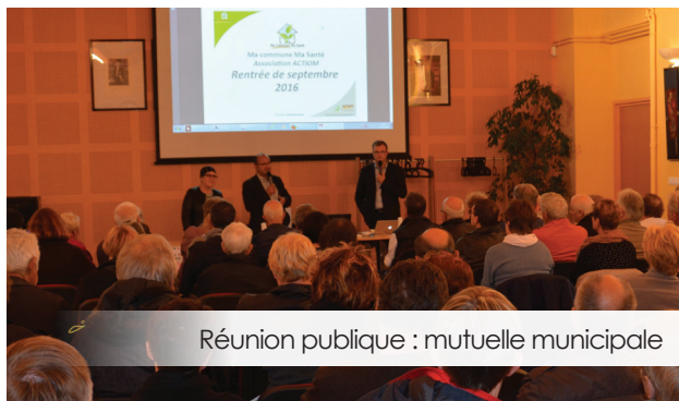
Réunion publique : mutuelle municipale