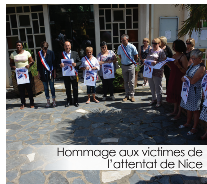
Hommage aux victimes de l'attentat de Nice