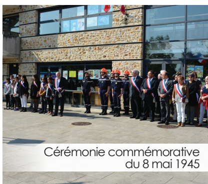
Cérémonie commémorative du 8 mai 1945