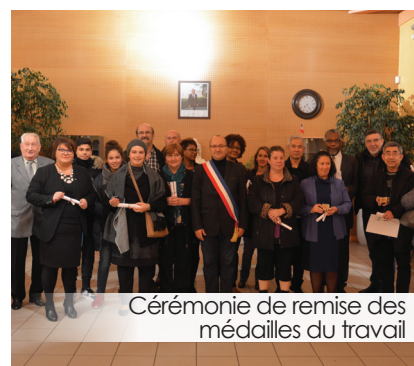
Cérémonie de remise des médailles du travail