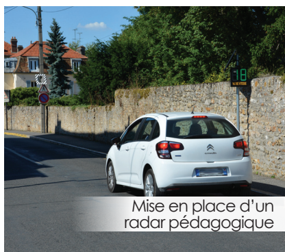
Mise en place d'un radar pédagogique