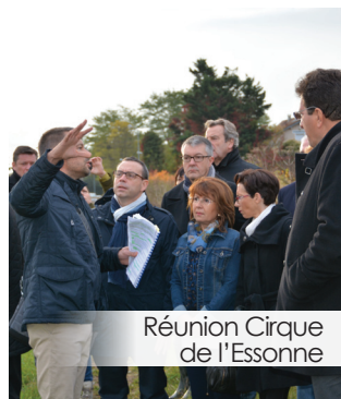
Réunion Cirque de l'Essonne