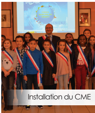
Installation du CME