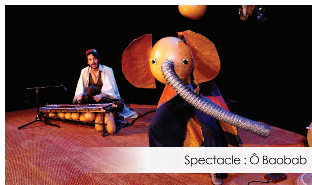
Spectacle : Ô Baobab