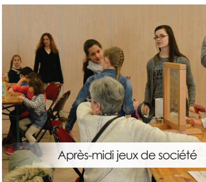
Après-midi jeux de société