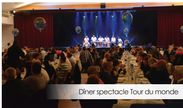
Dîner spectacle Tour du monde