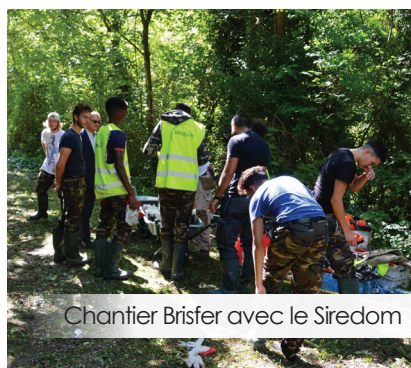
Chantier Briser avec le Siredom