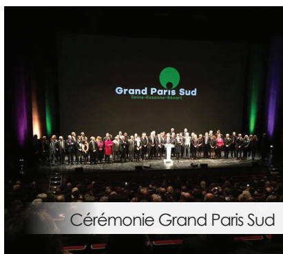
Cérémonie Grand Paris Sud