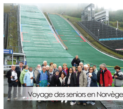
Voyage des seniors en Norvège