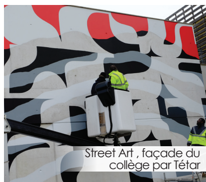
Street Art , façade du collège par Tétar