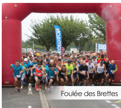
Foulée des Brettes