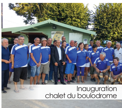
Inauguration chalet du boulo-drome