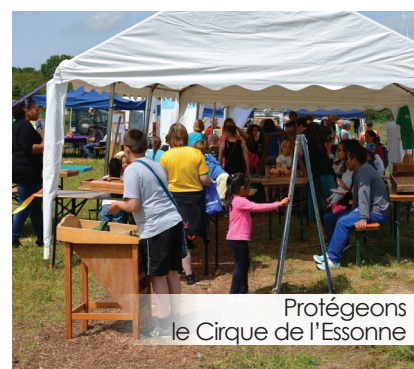
Protégeons le Cirque de l'Essonne