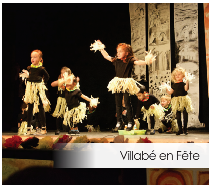
Villabé en Fête