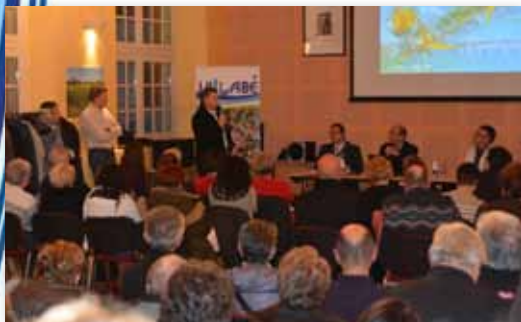
30 mars 2016 • Réunion publique à la salle Roger Duboz : Projets et contournement du Cirque de l'Essonne