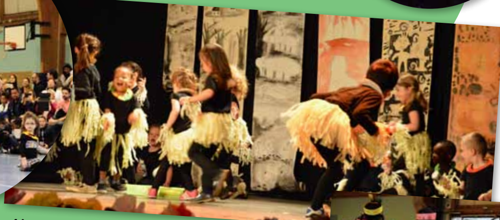
4 juin 2016 • Spectacle des Écoles maternelles Ariane et Jean Jaurès à l'Espace Culturel La Villa et au gymnase Paul Poisson