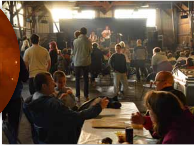
18 juin 2016 • Fête de la Musique avec les groupes Téquila Sol Fa , Walden , The Under Dealers et Minuit 6 heures puis Spectacle de Feu proposé par MV Cirque au Centre de Loisirs « les Copains d'Abord »