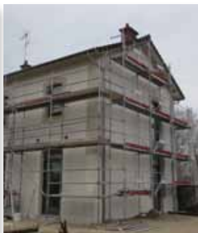
Ravalement et terrassement des extérieurs avec la mise aux normes d'accessibilité