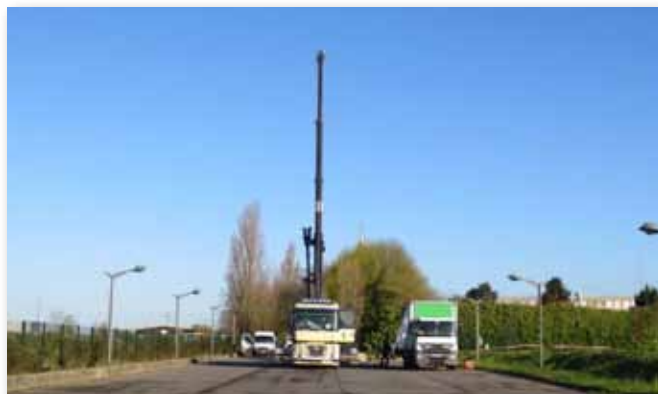
7 avril 2016 • Pose de l'antenne Free