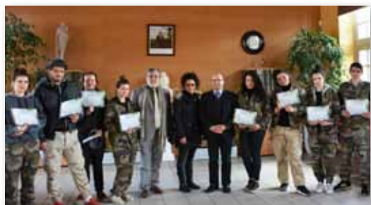
Avril 2016 • Chantier SIARCE