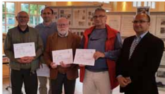
22 mai 2016 • Exposition de philatélie et de peinture, Salle Roger DUBOZ