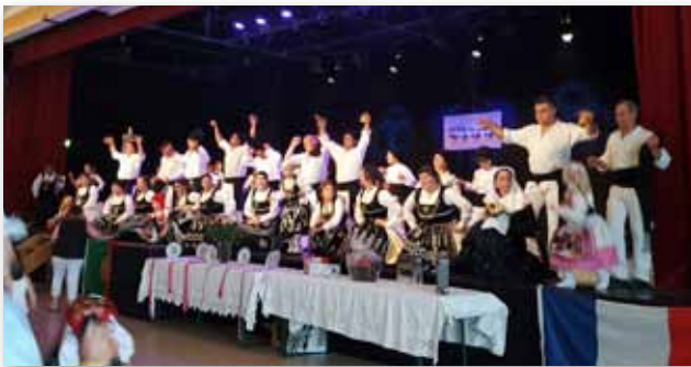
26 juin 2016 • Festival de danses portugaises à l'Espace Culturel La Villa