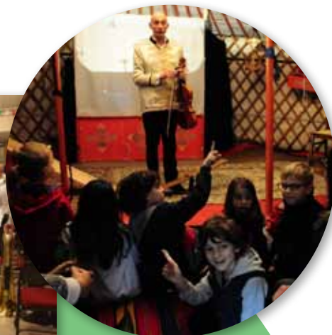
4 juin 2016 • Le Conservatoire Yves Henry, 123 Fiesta, l'Amicale de Villabé, l'association Les Roses du Portugal, l'exposition des écoles Ariane et Jean Jaurès et le spectacle Gadalka, l'entresort, ont animé l'après-midi.