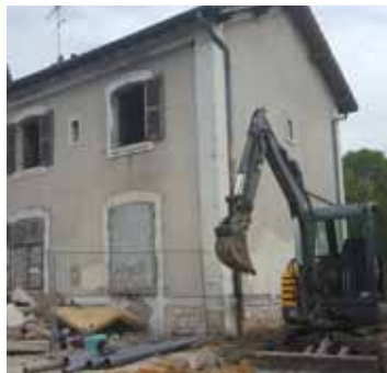
Travaux préparatoires de démolition et nettoyage

L'inauguration aura lieu le 2 septembre prochain en présence de François Durovray, Président du Conseil Départemental. En attendant, voici quelques étapes de cette réhabilitation en images.