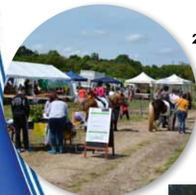
21 mai 2016 • Protégeons le Cirque de l'Essonne