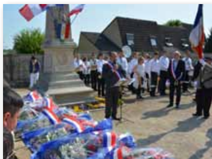
8 mai 2016 • Cérémonie Commémorative du 8 mai 1945