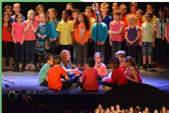
3 juin 2016 • Spectacle des Écoles élémentaires Ariane et Jean Jaurès à l'Espace Culturel La Villa