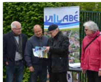
14 mai 2016 • Première réunion de quartier « les Heurts »