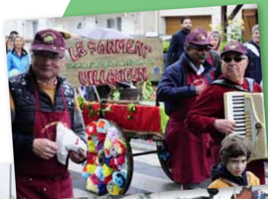
4 juin 2016 • Défilé « Tour du monde »