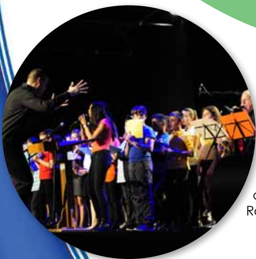
14 juin 2016 • Spectacle du Collège Rosa Parks