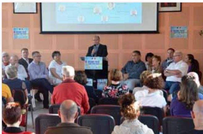
15 juin 2016 • Réunion publique : Bilan 2 ans à vos côtés