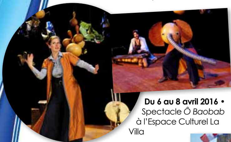
Du 6 au 8 avril 2016 • Spectacle Ô Baobab à l'Espace Culturel La Villa