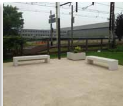
Aménagement de l'espace public extérieur