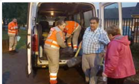
1 er juin 2016 • Déclenchement du plan de secours aux sinistrés des inondations au gymnase Paul Poisson