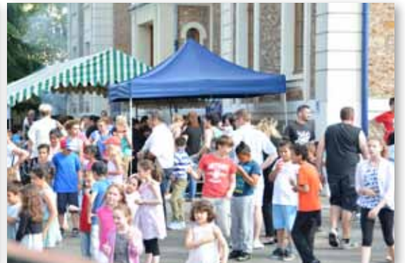
24 juin 2016 • Kermesse et spectacle musical du groupe scolaire Jean Jaurès