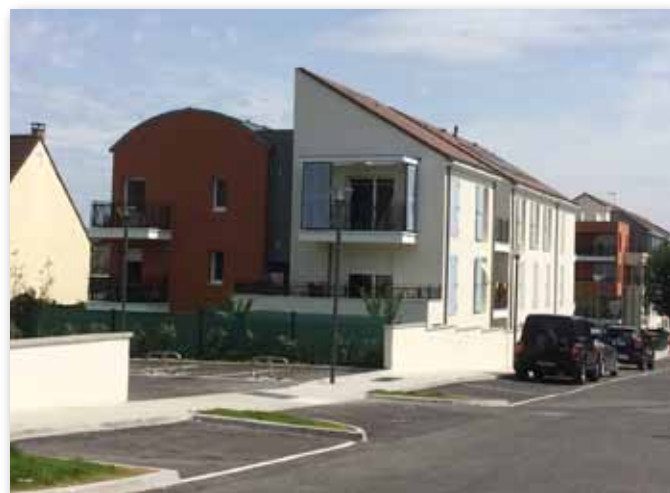
41 nouveaux logements Pierres & Lumières

Votre demande peut être modifiée à tout moment, sur internet ou auprès d'un guichet de logement social. Avec votre numéro d'enregistrement, votre dossier sera facilement identifié.