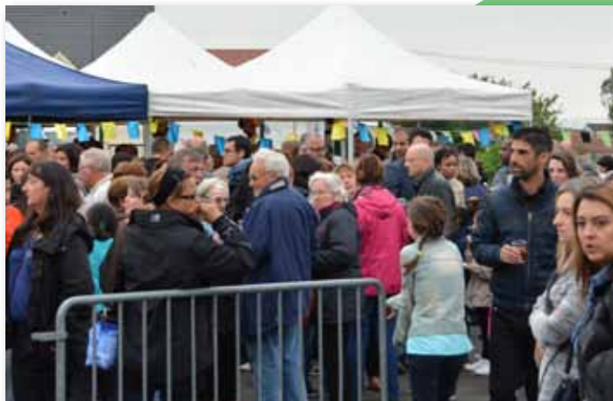
3 juin 2016 • Apéritif citoyen à l'Espace Culturel La Villa