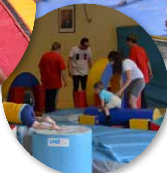
25 et 26 juin 2016 • Fête du Sport avec jeux gonflables, courses pédestres, démonstrations sportives, retransmissions de l'Euro 2016...