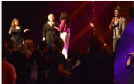
12 septembre 2015 Concert : Les 5 candidats de the Voice