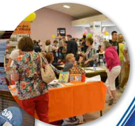
5 septembre 2015 Forum des associations