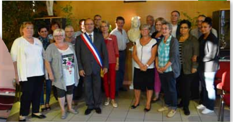
8 septembre 2015 Installation du Conseil Municipal des Sages