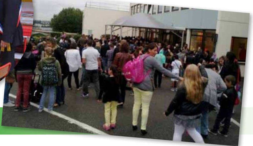
1 er septembre 2015 Rentrée scolaire