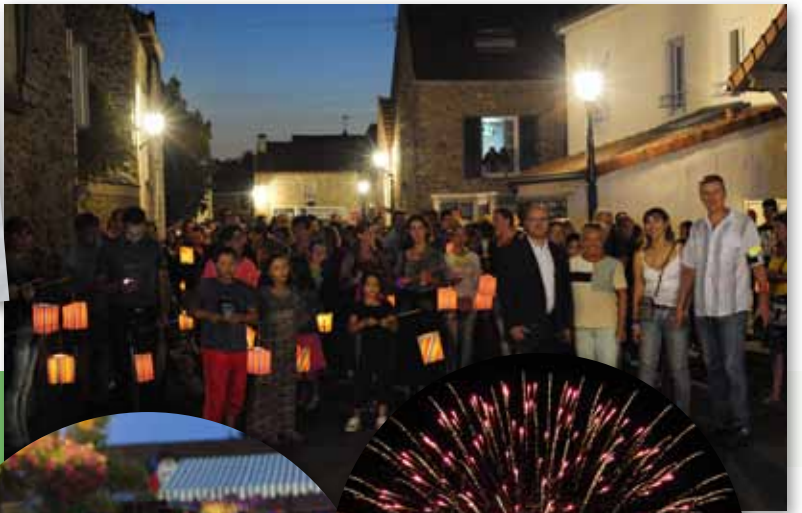
13 juillet 2015 Bal animé par le groupe Gouach et feu d'artifices