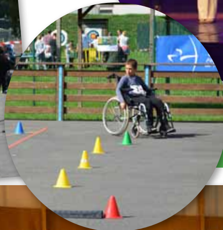
18, 19, 20 septembre 2015 Fête du Sport