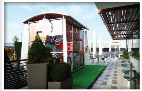
1 aire de jeux • 1 terrasse