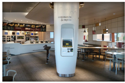
5 bornes de commande