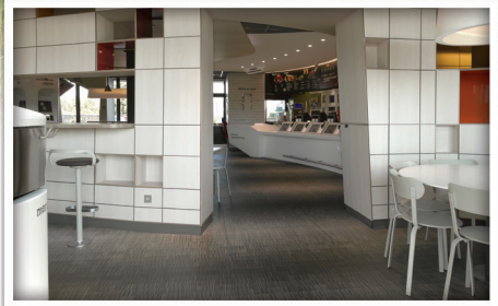
1 décor d'exception