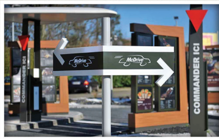
2 pistes Drive