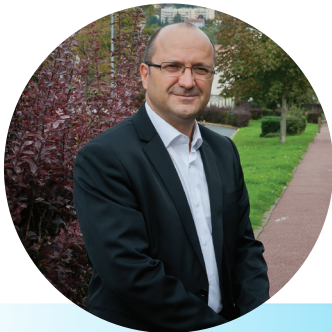
KARL DIRAT Maire de Villabé