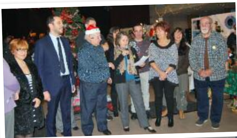
Les 7 et 8 décembre : Marché de Noël La magie de Noël avait envahi les murs de l'Espace Culturel la Villa pour le plus grand plaisir des nombreux visiteurs.