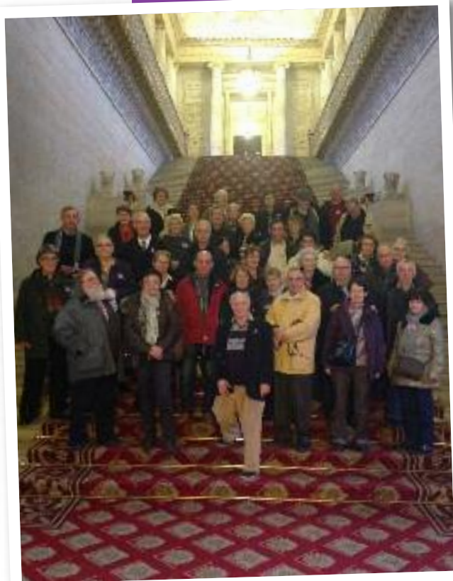
le 17 janvier : Visite du Sénat Dans le cadre des activités proposées par le CCAS, les seniors se sont rendus au Sénat, invités par le Sénateur Michel Berson.