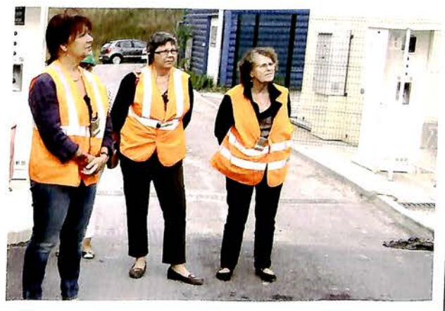
18 septembre 2012 : VISITE DE L'ECOSITE DE VERT-LE-GRAND A l'initiative de la SEMARDEL, Mme le Maire accompagnée des élus du Conseil Municipal se sont rendus sur l'Ecosite de Vert-le-Grand pour une visite guidée de leurs nouvelles installations et futurs projets comme le nouveau centre de tri pour les déchets industriels.