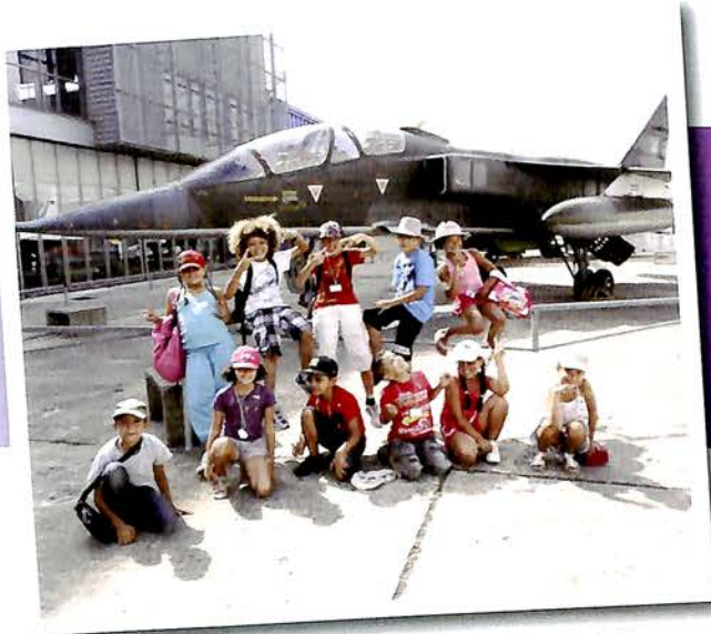
VACANCES AVEC LE CENTRE DE LOISIRS Cet été, les enfants du centre de loisirs de Villabé ont pu pratiquer de nombreuses activités et sorties proposées par l'équipe d'animation.