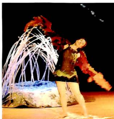
25 Janvier, Fauvette ou le vent de la colère : Les petits de la section maternelle (J. Jaurès et Ariane) ont rencontré ce petit oiseau, qui leur a fait découvrir le cycle des saisons.