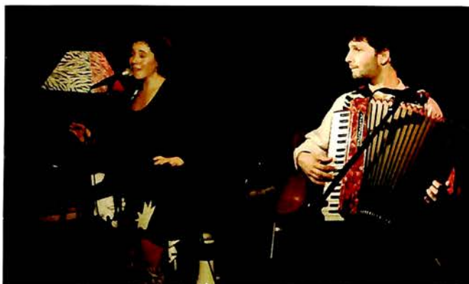
7 Janvier, Les Têtes de Linotte : nous les avons volontiers suivi dans leur univers déjanté.