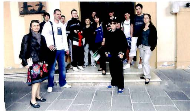
Avril, Dans le cadre du jumelage, l'association Villabéenne de basket a été accueillie à Migliarino pour un tournoi sportif.