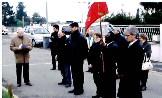
19 Mars, Commémoration du Cessez-le-feu en Algérie (19 Mars 1962).