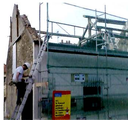
Travaux au Centre de Loisirs

Notre budget sera volontaire et raisonné. Il visera d'abord et avant tout à développer les services et prestations auxquels chaque Villabéen a droit. Nous n'emprunterons pas et investirons pour entretenir et embellir notre commune. Par ailleurs, nous continuerons à développer notre politique salariale et de formation en faveur des agents municipaux. Ces dépenses seront rendues possibles par les efforts de rationalisation et de vigilance financière, à tous les niveaux. Utiliser intelligemment les ressources de Villabé pour le bénéfice des Villabéens, voilà notre ligne de conduite.