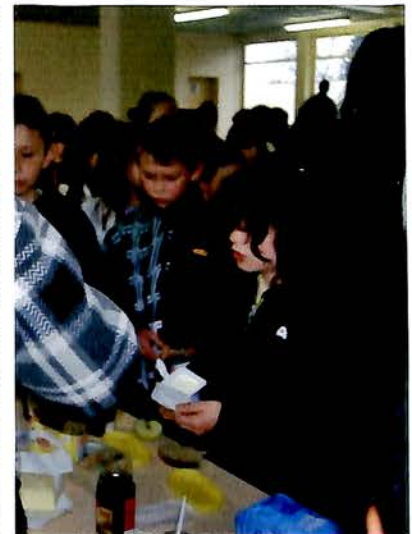
1 er Avril, Dans le cadre de la semaine du Développement Durable et en partenariat avec Yvelines Restauration, un petit déjeuner «BIO» a été servi à l'ensemble des enfants scolarisés dans nos groupes scolaires.