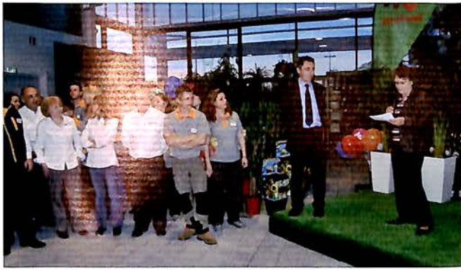
15 Mars, Inauguration du magasin Jardiland