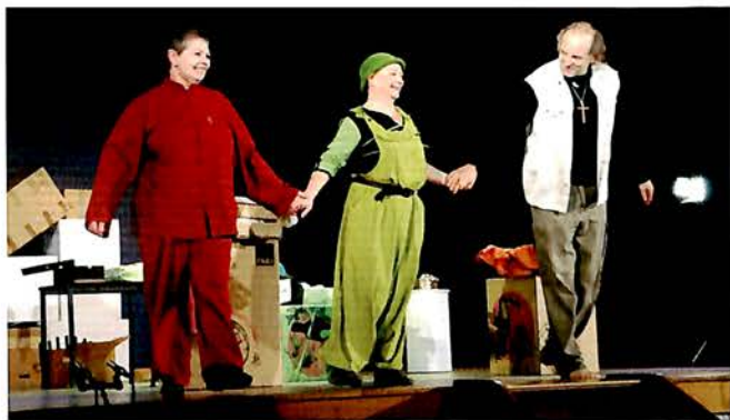
2 Avril, Représentation par l'ATV de la pièce «le ciel est égoïste».