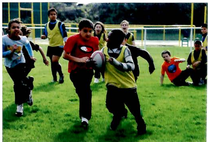
8 Avril, Scola Rugby : Comme l'an passé, sous l'impulsion de «la vie sportive» Scola Rugby fait son entrée dans les groupes scolaires Ariane et Jean Jaurès; le district de Rugby en collaboration avec les enseignants peut ainsi faire connaître les bonnes pratiques du Rugby pour le plus grand plaisir des jeunes.