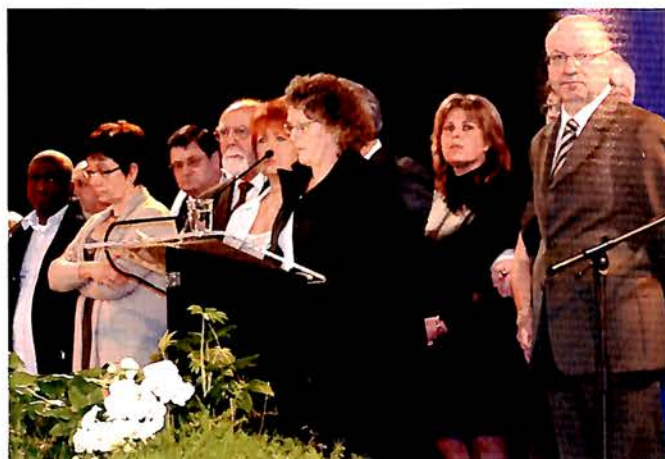
15 Janvier, Cérémonie des Voeux du Maire