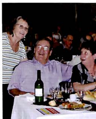
Du 9 au 15 octobre, semaine bleue : Comme chaque année, la semaine bleue a remporté un vif succès. Rencontres, spectacles et sorties ont rempli cette semaine appréciée par tous. Comme l'an passé, aux personnes ne pouvant se déplacer à la Villa pour le repas offert par la municipalité, des agents municipaux et membres du CCAS ont apporté leur repas à domicile.