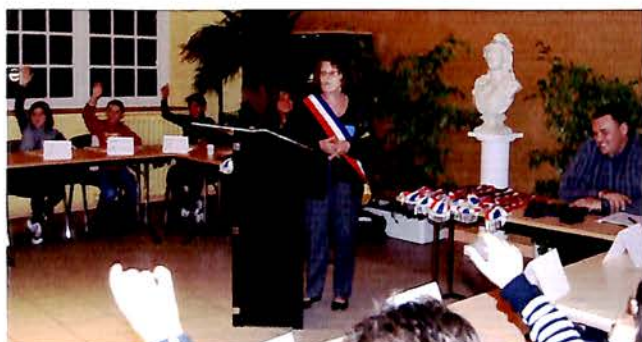
14 octobre, Conseil Municipal des enfants : Cérémonie d'installation du Conseil par Mme le Maire.