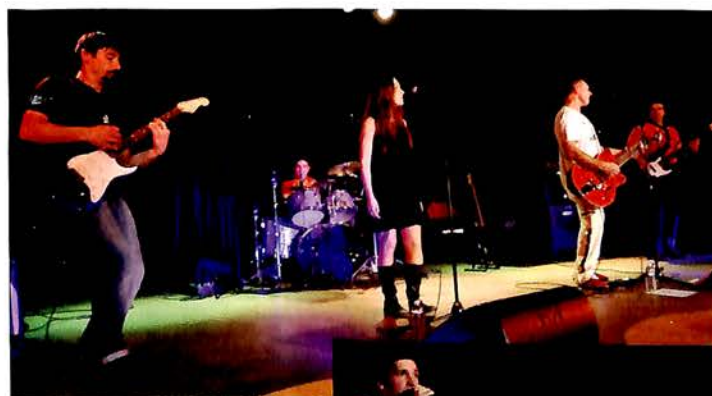
13 Novembre, Festi'villa d'Automne : Vous êtes venus nombreux à la soirée Rock'n roll, organisée par le service cultu- rel, applaudir les TKP et le groupe Steffy Mama.