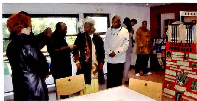
29 octobre : Dans le cadre des manifestations organisées par la CAECE pour la Coopération décentralisée, une délégation de la Ville de Kayes au Mali est venue visiter les infrastructures de la commune.