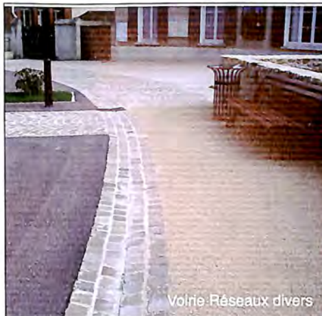
Voie Réseaux divers