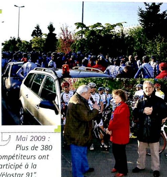
Mai 2009 : Plus de 380 compétiteurs ont participé à la "Vélostar 91".