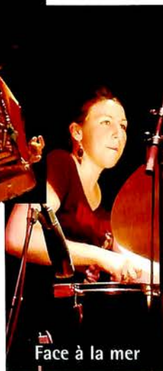
Face à la mer