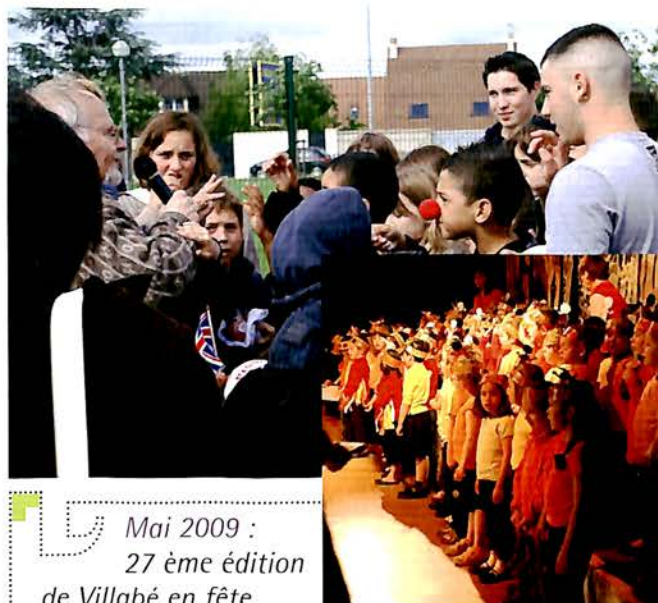
Mai 2009 : 27 ème édition de Villabé en fête Spectacle des enfants et kermesse, théâtre, danse portugaise, concours de boules, concert et le rallye.