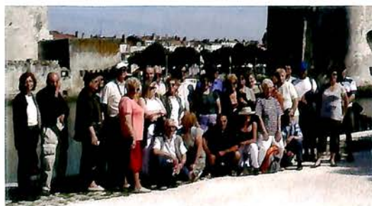
Juin 2009 : séjour en Charente Maritime pour nos Anciens, organisé par le CCAS de la Mairie de Villabé.