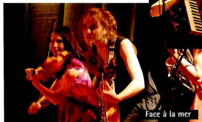
Face à la mer