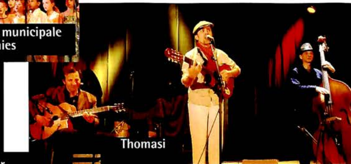
Face à la mer