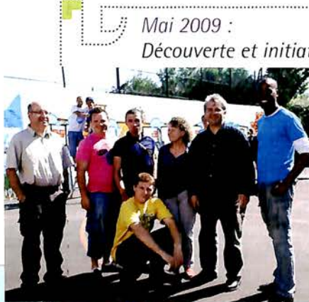
Mai 2009 : Découverte et initiation Hip Hop, Roller et graff. Les jeunes ont crée à la bombe une fresque sur le mur du court de tennis. Un challenge roller acrobatique accompagné des danseurs de Hip Hop a clôturé cette manifestation sous les regards impressionnés de chacun.