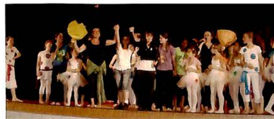
Juin 2009 : Premier Gala de l'association de danse "attitude" à la Villa, pour les petites de la section classique, et les 2 sections modern jazz.