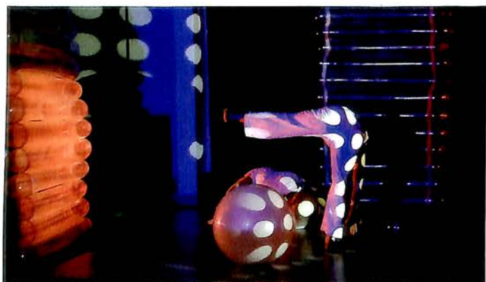
« Petites pièces chorégraphiques itinérantes »

Ensuite, c'est la Sicile de Luigi Pirandello que nous avons croisée le vendredi 10 et samedi 11 décembre au gymnase Paul Poisson, avec « A chacun sa vérité », une parabole philosophique servie sur un ton léger.