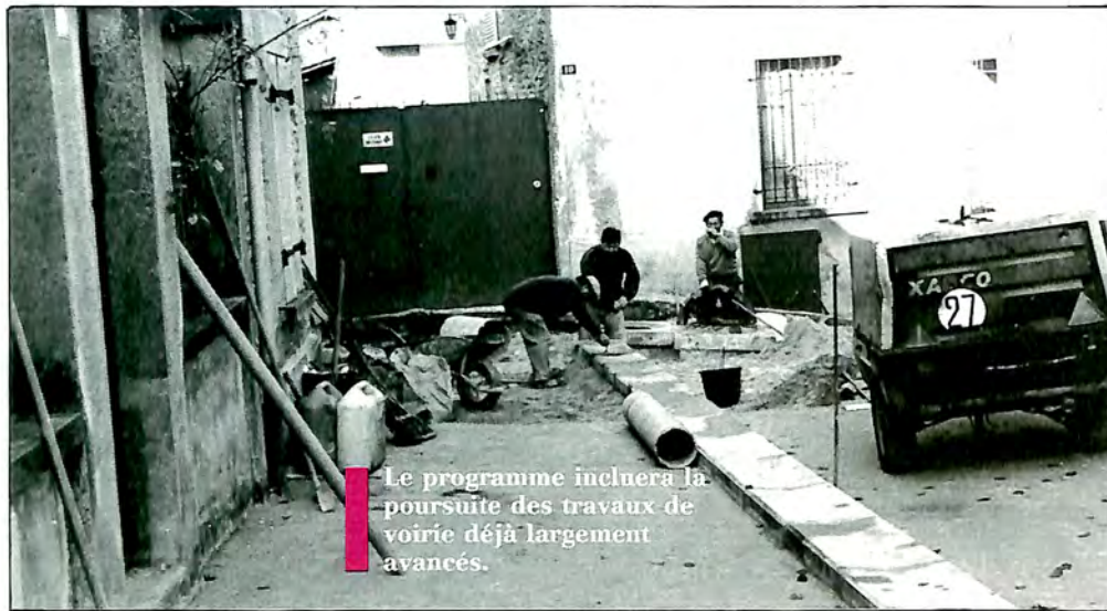
Le programme inclura la poursuite des travaux de voirie déjà largement avancés.