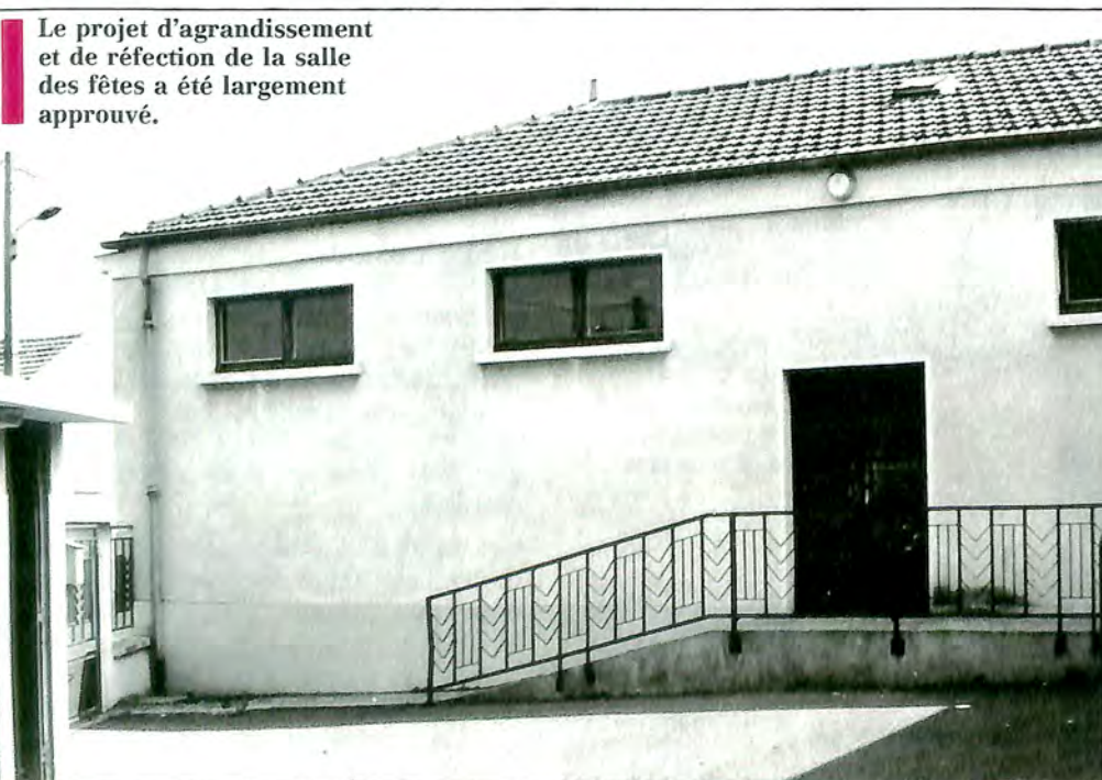
Le projet d'agrandissement et de réfection de la salle des fêtes a été largement approuvé.