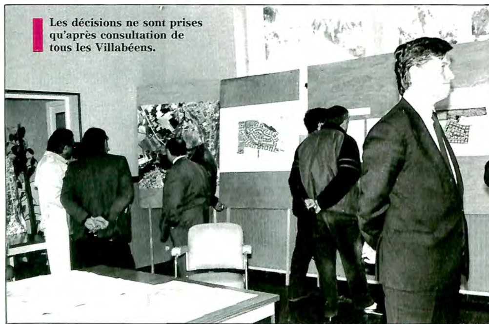
Les décisions ne sont prises qu'après consultation de tous les Villabéens.