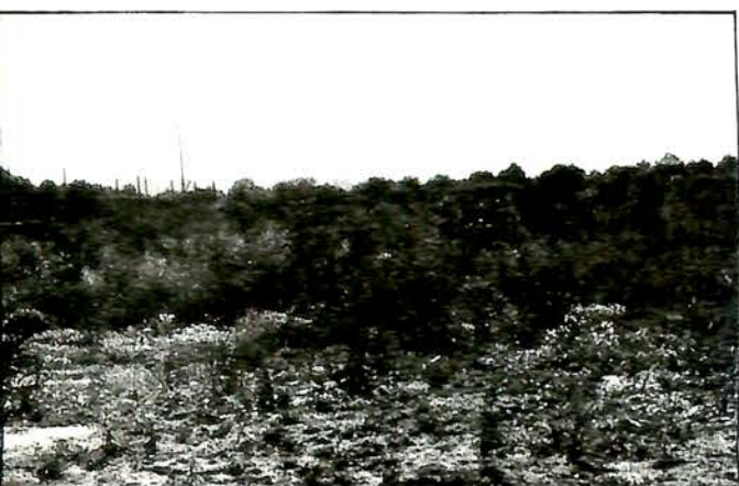
Sur ce terrain, la salle polyvalente verra bientôt le jour.

Avec le Contrat Régional, de nouveaux équipements vont venir compléter les structures déjà existantes à Villabé.